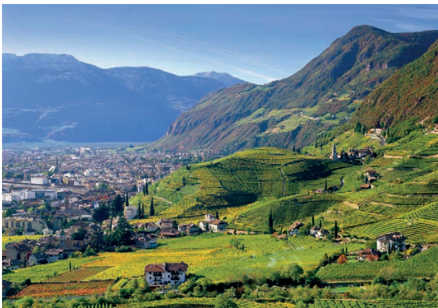
Abb. 1: Bozen, Luftbild