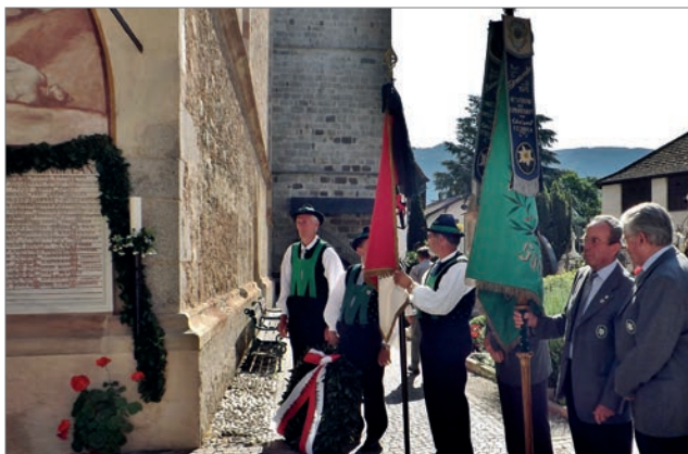
Die Abordnungen der Ortsgruppe des Südtiroler Kriegsoffer- und Frontkämpferverbandes und der Kameradschaft vom Edelweiß nehmen Aufstellung.