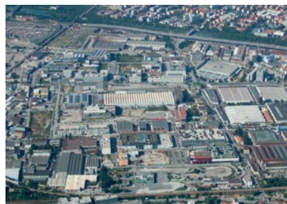
Abb. 8: Die Industriezone, die seit dem in den späten 1930er Jahren begonnenen Bau der Arbeiterwohnsiedlungen, den sogenannten Semirurali, ständig gewachsen ist und, wie die meisten Gewerbegebiete, einen eher chaotischen Eindruck erweckt.

Sehr viele Gestaltungsabläufe passieren schleichend, aber kontinuierlich auf einer Ebene, auf welche die Heimatpflege nur begrenzt Einfluss nehmen kann. Bei größeren Szenarien versucht der Heimatpflegeverband, sich beratend einzubringen und gegebenenfalls auch mit gezielten Aktionen (Unterschriftenaktionen, Protestkundgebungen, Bürgerversammlungen)