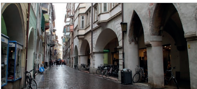
Abb. 5: Die aus dem 12. Jahrhundert stammende Laubengasse, eine mittelalterliche Straßenmarktanlage und seit jeher Kern des alten und vor allem geschäftigen Bozen

Die historischen Lauben werden nach und nach von den alteingesessenen Handelsfamilien verlassen und die Geschäfte