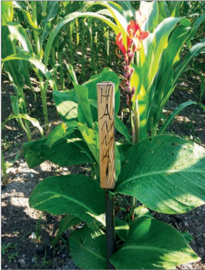
Jedes Kind hat auf dem Maisfeld seine eigene Zeile, welche es von Anfang bis Ende betreut.

Dieser Tradition fühlt sich die Unterlandler Arbeitsgruppe heute noch verpflichtet. Sie kennt den Nutzen der ertragreichen Getreide- und Gemüsesorten und darüber hinaus die Wirkung anderer Pflanzen, wie beispielsweise Kräuter, um Schädlinge auf natürlichem Wege zu bekämpfen. So wehrt zwischen den Tomaten gepflanzter Thymian Nacktschnecken ab, Kapuzinerkresse sieht nicht nur hübsch aus, sondern hält auch den Kartoffelkäfer fern oder Stangenbohnen kombiniert mit Bohnenkraut mindern den lästigen Lausbefall.