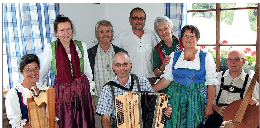
Gruppenfoto der Teilnehmer und Teilnehmerinnen

sowie einige Gäste in gemütlicher Atmosphäre beisammen.