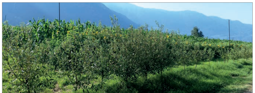
Das Grundstück des Gemeinde- bzw. Schulackers wurde mit Stockeichen – einer heute nur mehr selten anzutreffenden Baumart – eingefriedet.

Geld spielt in diesem großartigen Projekt keine Rolle. Weder die Mitglieder der Arbeitsgemeinschaft, noch die freiwilligen Helfer und Spender (Ziggel, Gartenbänke, Pumpe, etc.) werden monetär entlohnt. Nach der Ernte aber werden die Erzeugnisse auf sämtliche Helfer aufgeteilt; viel ist es nicht, maximal 10 Kilogramm Mehl können pro Person abgegeben werden. Der Rest wird für das folgende Jahr als Saatgut zurückgehalten. Damit sind alle zufrieden, ist doch der Genuss eines mit eigenen Händen angebauten und verarbeiteten „Plent“ unvergleichlich größer als der Verzehr handelsüblicher Ware.