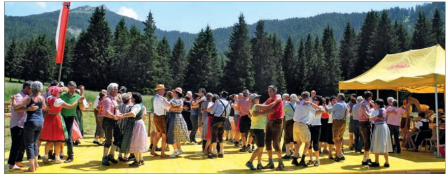
Viele Tänzerinnen und Tänzer füllten den Tanzboden.