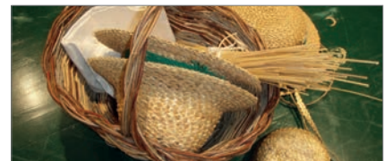
Nicht jeder Strohalm eignet sich für die Fertigung von Hüten. Bei genauerem Hinsehen erschließt sich erst die geduldige Arbeit, die hinter der sommerlichen Kopfbedeckung steckt.