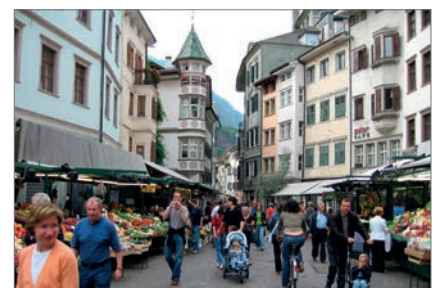
Abb. 11: Eindrücke vom Markt