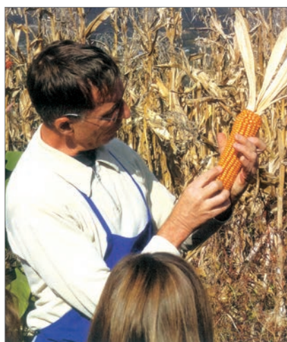
Die Schülerinnen und Schüler erfahren bei jedem Arbeitsschritt – hier bei der Ernte – Wissenswertes.

ren einer komplexen Infrastruktur und Logistik angewiesen“ (Grundsatzpapier der Arbeitsgruppe). Diese Tatsache hat bei den Heimatspflegern in Kurtatsch einige grundlegende Fragen aufgeworfen: Wie lange könnte sich der Südtiroler Durchschnittshaushalt ohne Lebensmittelnach-