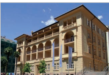
Abb. 9: Universitätsgebäude mit Palmen