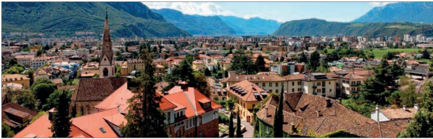
Abb. 7: Gries, ehemals eine eigenständige Gemeinde, wurde 1926 von den Faschisten in die Landeshauptstadt zwangseingemeindet.

an große Einkaufsketten vermietet. Diese reißen die einstmaligen kleinen Hauseingänge auf und bauen enorme Geschäftseingänge, die das äußere Erscheinungsbild stark beeinträchtigen. Die oberen Stockwerke werden als Lager verwendet oder an Migranten vermietet. Nach Geschäftsschluss ist die Altstadt ausgestorben.