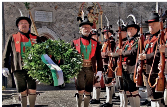
Kranzniederlegung für die Standschützen des Bataillons Lana durch die Schützenkompanie „Franz Höfler“, Lana

beiten beauftragt. Er schuf nicht nur das monumentale Wandfresko, sondern entwarf die Marmortafeln mit den Inschriften, die Wandleuchter und den hölzernen Dankesschild der Kriegsheimkehrer links vom Haupteingang. Die Ausmalung der Vorhalle und die Fassung der Gewölberippen gehen gleichfalls auf ihn zurück.