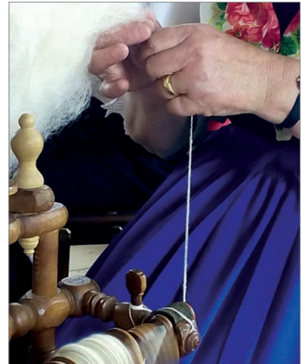
Wolle waschen, kämmen und spinnen: Nur mehr wenige beherrschen diese Kunst.

bedacht: Stoffe durften befühlt werden, in rohe Wolle gegriffen, Trachtenschuhe und Sarnen standen zur Anprobe bereit und am Spinnrad konnte unter Anleitung gar Wolle gezwirbelt werden.