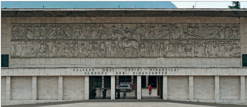
Abb. 3: Bozen, Finanzgebäude mit dem umstrittenen Relief