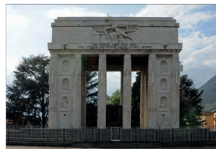
Abb. 2: Bozen, Siegesdenkmal

Was die Kultur-Landschaft betrifft, so wurde durch die – wenn auch für viele Menschen sehr leidvolle – Trennung vom Heimatland Tirol ungewollt eine Besonderheit geschaffen, die heute von den Tourist*innen gerne als Attraktion gehandelt wird: Bozen liegt in Italiens nördlichster Region und wird von der Zentralregierung regelmäßig als eine der lebenswertesten Metropolen des ganzen Staates gekürt. In der Ursprungsheimat Österreich spricht man von der „Toskana Tirols“, die man bei jeder Gelegenheit gerne besucht.