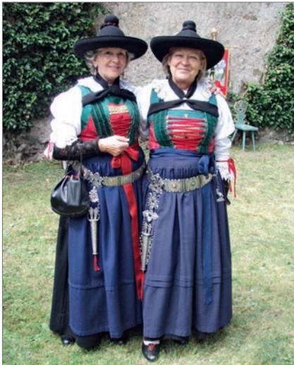
Heute ist der Silbergürtel der Buchensteiner Frauentracht nur mehr ein schmuckes Detail; der metallene Blickfang verbirgt aber nach wie vor kunstvoll gearbeitetes Besteck für unterwegs.