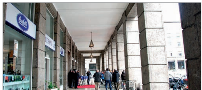
Abb. 6: Die den historischen Lauben nachempfundenen und im rationalistischen Baustil von den Faschisten verwirklichten Arkadengänge im neuen Stadtteil von Bozen