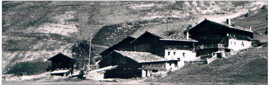
Die Örlhöfe vor dem Abriss

Mit dem Bau des Vernagt-Stausees nach dem 2. Weltkrieg musste neben sechs weiteren Höfen auch der Unterörlhof aufgege-