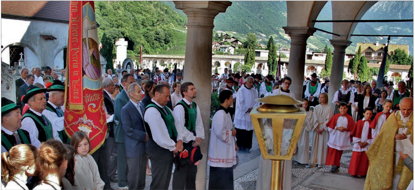
Die Gedenkfeier unter der Vorhalle fand im Anschluss an die Fronleichnamsprozession statt.

Gedenkfeier vor dem restaurierten Kriegerdenkmal in Niederlana