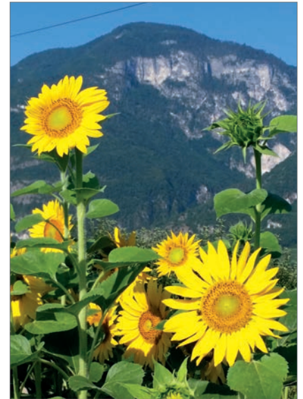
Sonnenblumen säumen das Maisfeld der Arbeitsgemeinschaft.