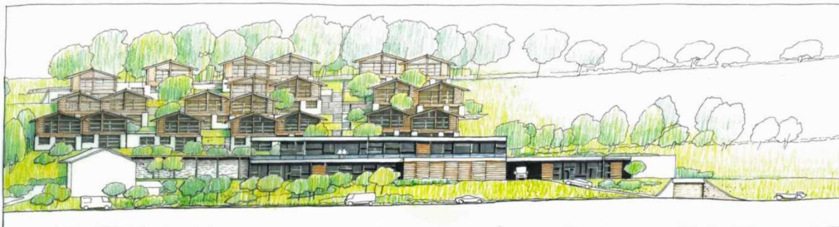
Vorprojekt Chaletdorf in Feldthurns