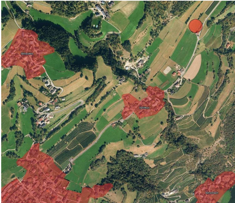
Position weit außerhalb des Dorfes (über 1 km vom Dorf entfernt)